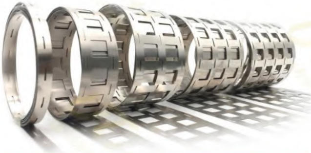
شريط النيكل المختوم