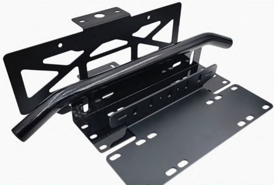
حامل لوحة الترخيص

المواد: سبائك الألومنيوم | الفولاذ المقاوم للصدأ | SPCC. العملية: القطع بالليزر | الصفائح المعدنية | لحام. السطح: الرحلان الكهربائي | أنودة | رش الطلاء | مسحوق الطلاء. اللون: حسب الطلب.