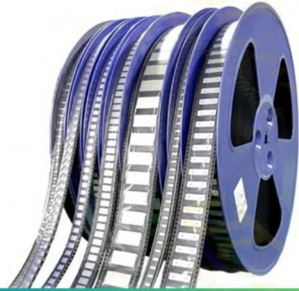
شريط النيكل SMT