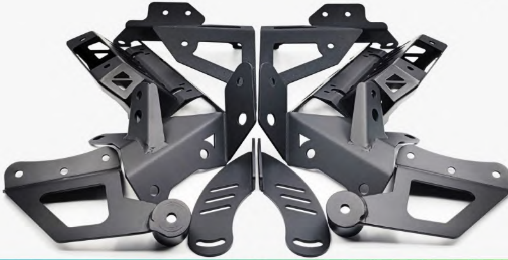
قوس تركيب شريط الضوء LED