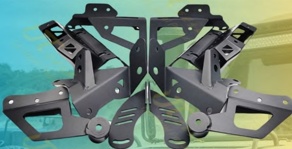
КРОНШТЕЙН КРЕПЛЕНИЯ LED